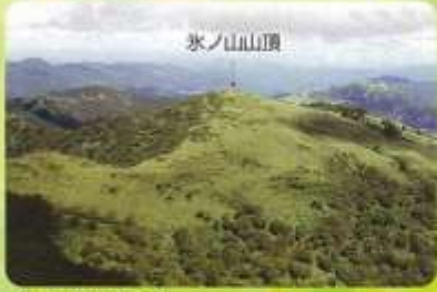
氷ノ山南側上空より

0 500 1000 1500 至 中間、大屋市場、大屋川 至 秋岡・R9 至 秋岡・R9 至 若桜・R29 至 中岡、大屋市場、大屋川 至 中岡、大屋市場、大屋川 (縮尺1:25,000)